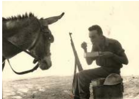
צוער בבה"ד-1, ב"סידרה" בשטח, עם חבר אקרעי ...