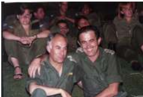
בתמונה: עם צביקה אורן ש"סללתי את דרכו" לקחש"ר....

לי באופן אישי, היה ברור שתפקידי במש"א בחיפה הוא האחרון לשרותי ומהווה בהחלט סיום נאות והכנה לחיים האזרחיים. אין לכן כל פלא שהופתעתי מאד מההודעה, וברוח זו גם הודעתי במקום ל-ר. אג"א, שאני מאד מודה לו, אך איני יכול לקבל את הסיכום ואני גם חש ניפגע על כך שמקבלים החלטות חשובות לחיי מבלי להיוועץ עימי תחילה . יתרה מכך, אם צה"ל חושב שאני יכול לסיים היום את תפקידי במש"א 7200, אחרי שנתיים בלבד, ולא רואים בכך "בגידה" בערכים ובמערכת, הרי שאת החלק הזה בלבד של הודעתו אני מוכן לקבל, דהיינו שאני מסיים במייד את תפקידי במש"א, אלא שלא למען הקידום הצבאי, אלא למען עתיד המשך חיי הפרטיים במסלול האזרחי, דהיינו: הודעתי לו על כוונתי להשתחרר בתוך חודש מאותו היום, סופי! הפעם הוא נידהם . התפתחה שיחה מעניינת. הוא טען שרצה להפתיע אותי לטובה ואכן הוא הפתיע... הוא טען שאם אתעקש להשתחרר אזי אני סולל את דרכו של אל"מ צביקה אורן יחידי לתפקיד הקחש"ר, השבתי לו במקום, שאני מאחל לו הרבה הצלחה .