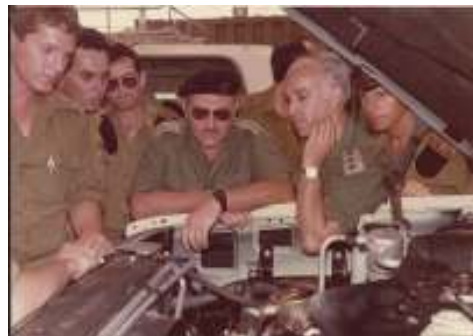
ר. אגא - האלוף חיים ארז בביקורו במש"א