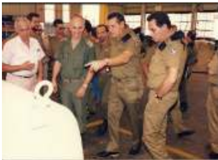
ר. אגא - האלוף מנחם עינן בביקורו במש"א

הזמנים היו קשים אז למש"א 7200. ליין הסבת הזחל"מים לזחל"דים היה בסופו. היתה גם האטה בקליטת רכבים חדשים מחו"ל, בעיות תקציב איימו על ליין שיקום המשאיות והוחל לדבר על צימצומים. החלה ה"מלחמה על חיי המש"א". סם החיים לכך היה יכול להיות ליין חדש שייספק עבודה לשנים הבאות, וכניסה למשימות חדשות שלא עסקו בהן עד אז.