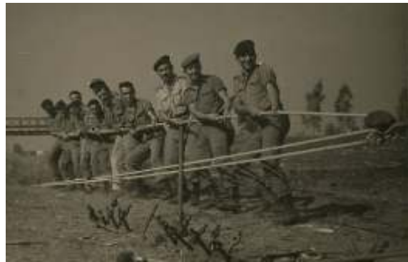
צוער בבה"ד-20 (1962) קורס קצינים חיילי, ב"סידרת חילוץ בשטח"

ינואר 1963 - יחש"מ-651 בדרגת סג"מ. (פעם שנייה ביחש"מ, הראשונה היתה כחייל מסגר בין הטירונות לקורס בבה"ד 20)