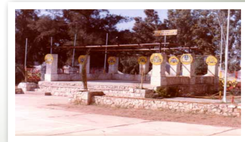
במת מגרש המסדרים שנחשפה