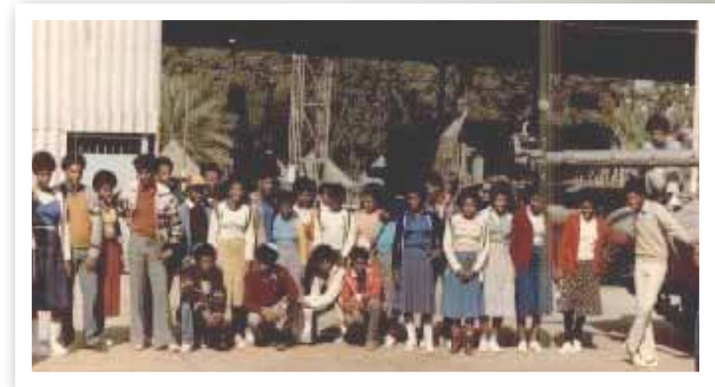
ביקור עולי אתיופיה בבסיס חיל החימוש

במהלך מבצע עליית יהודי אתיופיה, בשנת 1984, עלו לישראל כ-8,000 יהודים. המבצע נקרא "מבצע משה" על שמו של משה רבנו, וכסמל לתפיסת גאולת היהודים מאתיופיה בדומה ליציאת מצרים. המבצע היה סודי ביותר לאור האיסור של יהודי אתיופיה לצאת מגבולות המדינה. העולים, שרצו להגיע לישראל, נאלצו לעבור מסלול ייסורים בדרכם אליה. תחילה היה עליהם להגיע בסתר לגבול סודן. לצורך כך התארגנו בקבוצות קטנות ובשיירות, ויצאו לדרך הארוכה. רובם צעדו ברגל ונתקלו בדרך