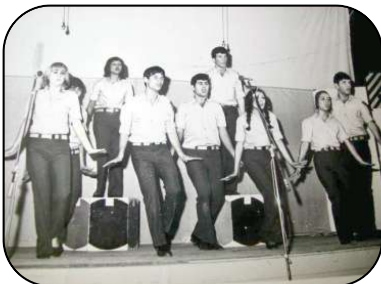
להקת סדנאי השריון בראשית דרכה

עם הפסקת האש בחזית המצרית החלה תקופה שקטה יחסית, והסדנה התפנתה לתיקון גנרטורים ולטיפול מחודש במחסני החרום. גם טיפוח חזות המחנה עלה שוב לראש מעייניהם של המפקדים, והתוצאות לא איחרו לבוא: הסדנה זכתה בפרס המשק של צה"ל במשך מספר שנים ברציפות. כדי להרים את המוראל ולהגביר את המוטיבציה והגאווה של חיילי הסדנה שהיו פרוסים במרחב, הוקם צוות הווי שהיה מורכב מחיילי היחידה. "סדנאי השריון" הופיעו בפני החיילים ביחידות השונות ועודדו את רוחם.